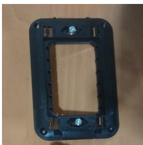
Слика 3 (ставка 17)

Поклопац за механизам није тражен, јер није потребан.