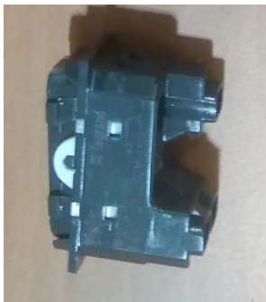
Слика 1 (ставка 2)

Утичница је модуларна монофазна (Слика 2).