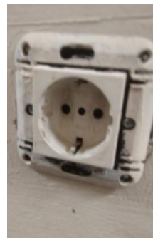
Слика 2 (ставка 8)