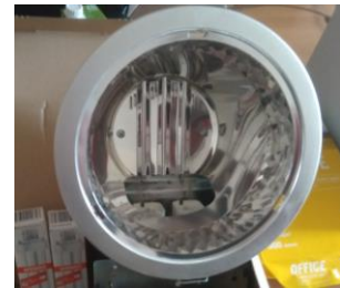
Слика 5 (ставка 22)

Ознака лампе тражене у позицији 22, праћена је речима „или одговарајуће“, а на страни 10/39 КД Наручилац је навео шта је одговарајући производ/материјал: